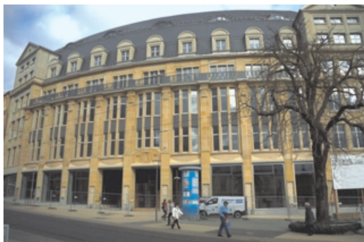
Die Außenfassade am Postplatz ist fertig.

Im Dachgeschoss musste die Höhe der Treppen angepasst werden. Es entstand im Bereich des zukünftigen Katasteramtes auch ein barrierefreier Zugang. Auch im gesamten Haus ist die Barrierefreiheit gewährleistet-