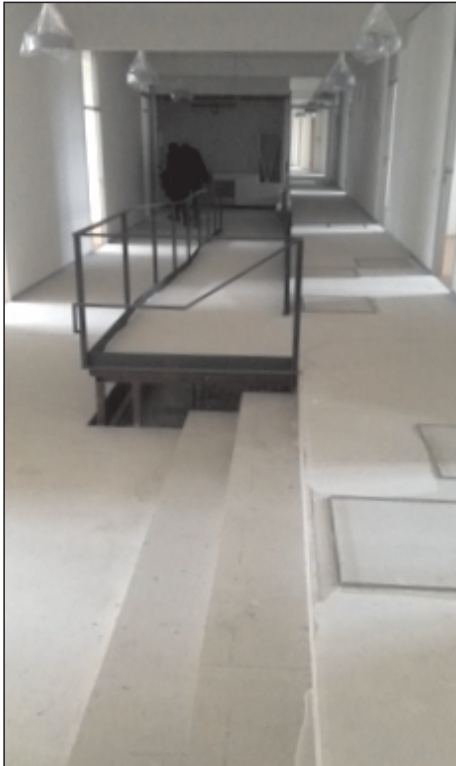
Im Altbau zum Postplatz sind die Räume fast einzugsbereit.