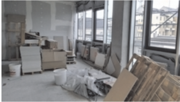
Im Neubau an der Rädelsstraße ist der Innenausbau im vollen Gange.